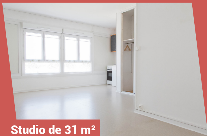
Studio de 31 m 2